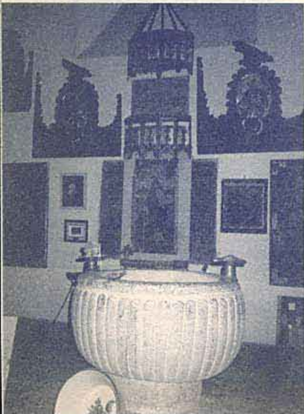
Pila bautismal de Isabel la Católica en la iglesia de San Nicolás de Bari en Madrigal (Ávila).

(Jean DEMONT, El nacimiento de España Moderna , publicado por Cuadernos del Aula de Teología, Madrid 1994, pp. 10 y 11)