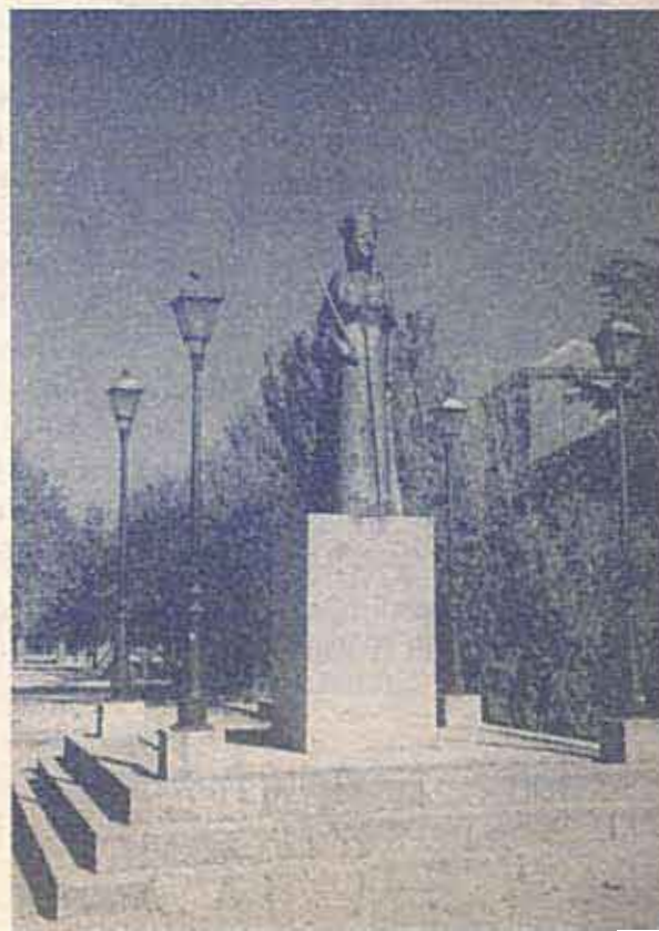
Statue of Isabel the Catholic in Madrigal de las Altas Torres (Ávila).