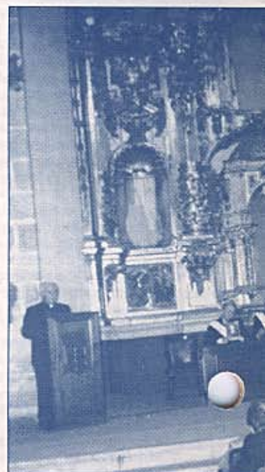
Actividad de los Cabal