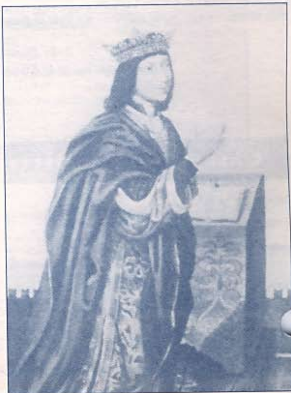
Fernando el Católico.

(En el próximo número de ISABEL : el matrimonio de Isabel con Fernando)