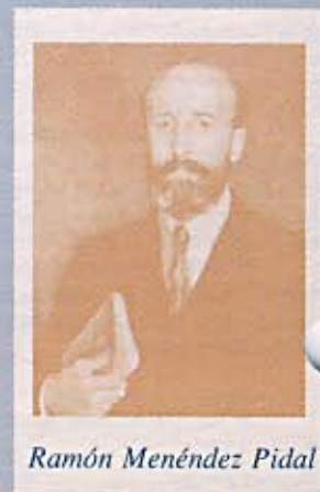
Ramón Menéndez Pidal

La convención internacional «PATH TO ROME» patrocinada por Miles Jesu, se celebrará del 19 al 21 de septiembre de 1997, en Nueva Orleans, Luisiana, EE. UU.