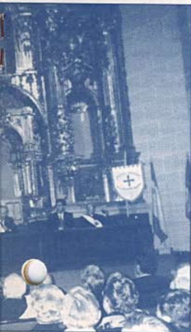
Altars de la Reina Isabel.