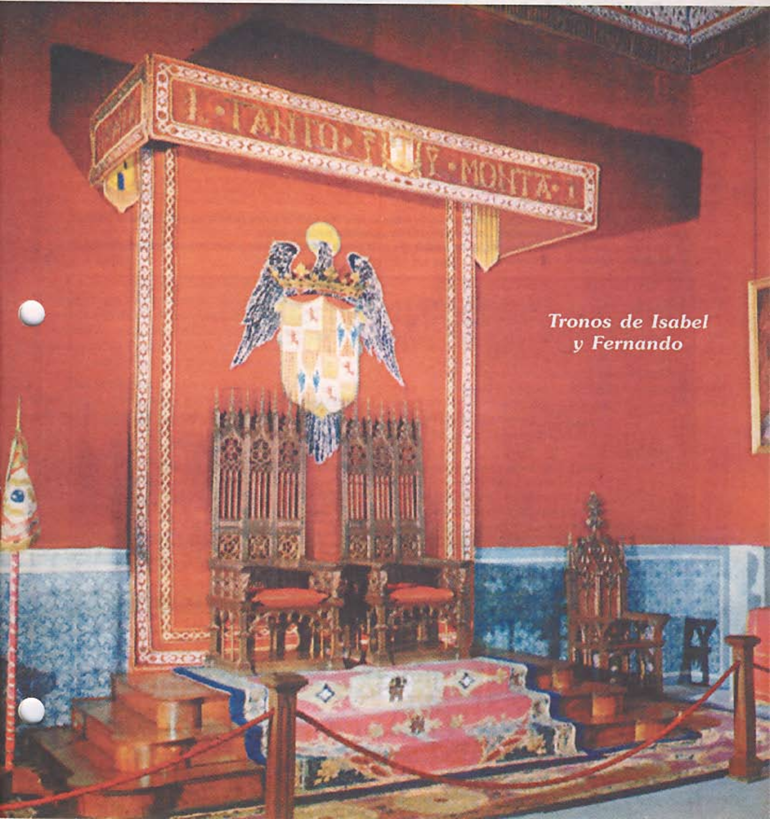
Tronos de Isabel y Fernando

REVISTA INTERNACIONAL DE LA SIERVA DE DIOS INTERNATIONAL MAGAZINE OF THE SERVANT OF GOD