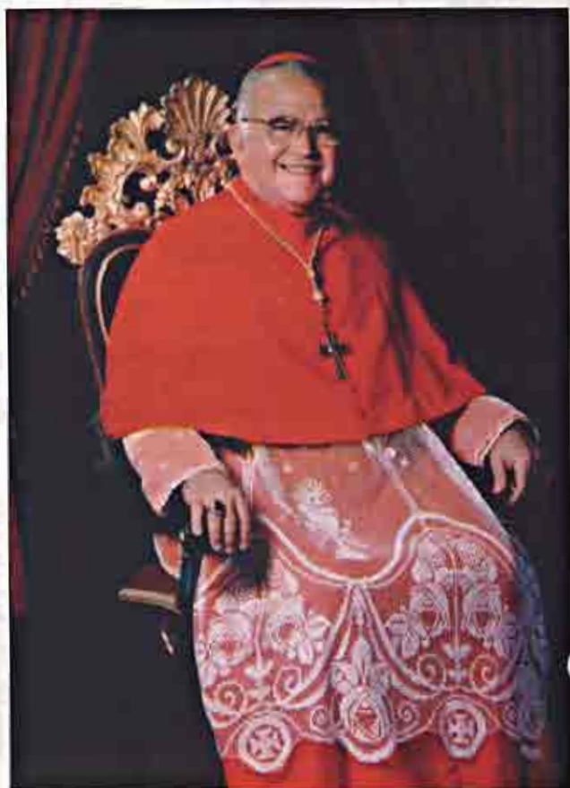
S. E. Luis Cardenal Aponte Martínez

His Eminence Luis Cardinal Aponte Martínez