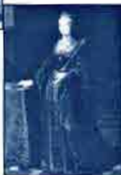
La Reina Isabel la Católica