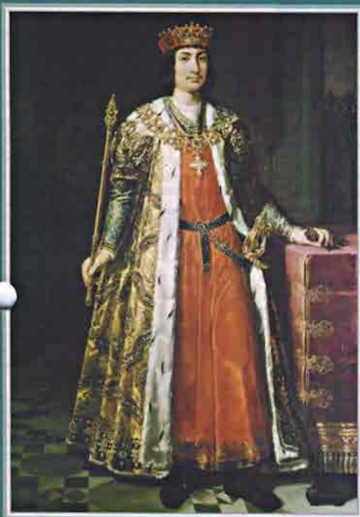
El Rey Fernando el Católico

REVISTA INTERNACIONAL DE LA SIERVA DE DIOS INTERNATIONAL MAGAZINE OF THE SERVANT OF GOD