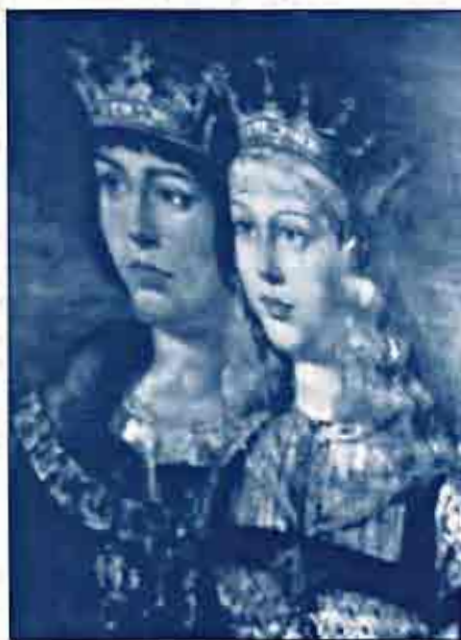
Isabel y Fernando como jóvenes esposos Isabel and Ferdinand as a young couple

de los reales cónyuges corresponde, tomando como base el propio contrato matrimonial de ambos. Se establece que la justicia sería administrada por los dos cuando estuvieran juntos, y por separado cuando no lo estuvieran, que las Reales Cartas llevarían las dos firmas; las monedas los bustos de ambos; y los sellos las armas de Castilla y de Aragon, correspondiendo a