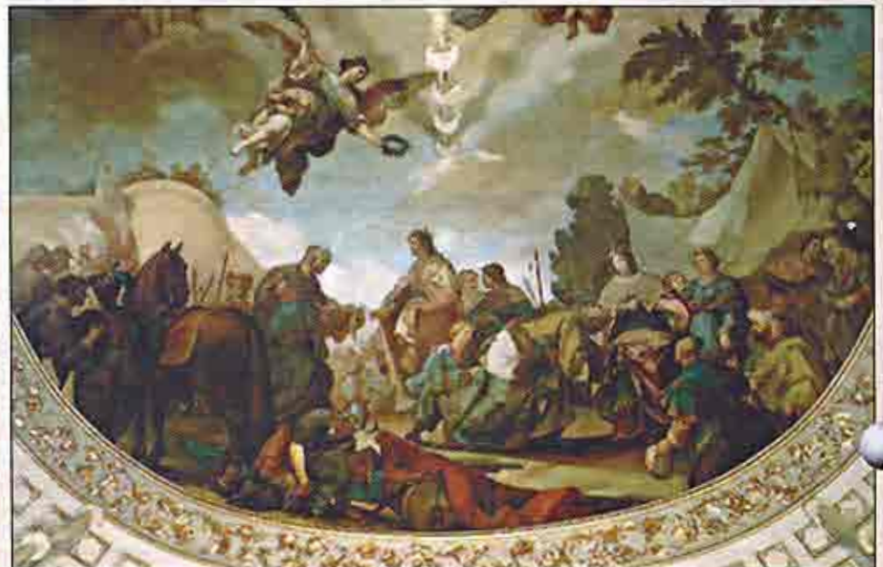
Boabdil entregando las llaves de Granada a los Reyes Católicos, por Francisco Bayeu

Las feministas radicales del siglo veinte es un grupo que está muriendo. En la primavera del milenio, transformemos la cultura de muerte que ellas están dejando tras de si honrando la memoria y promoviendo la Causa de la gran defensora de la vida y los derechos humanos del hombre y de la mujer, Isabel la Católica.