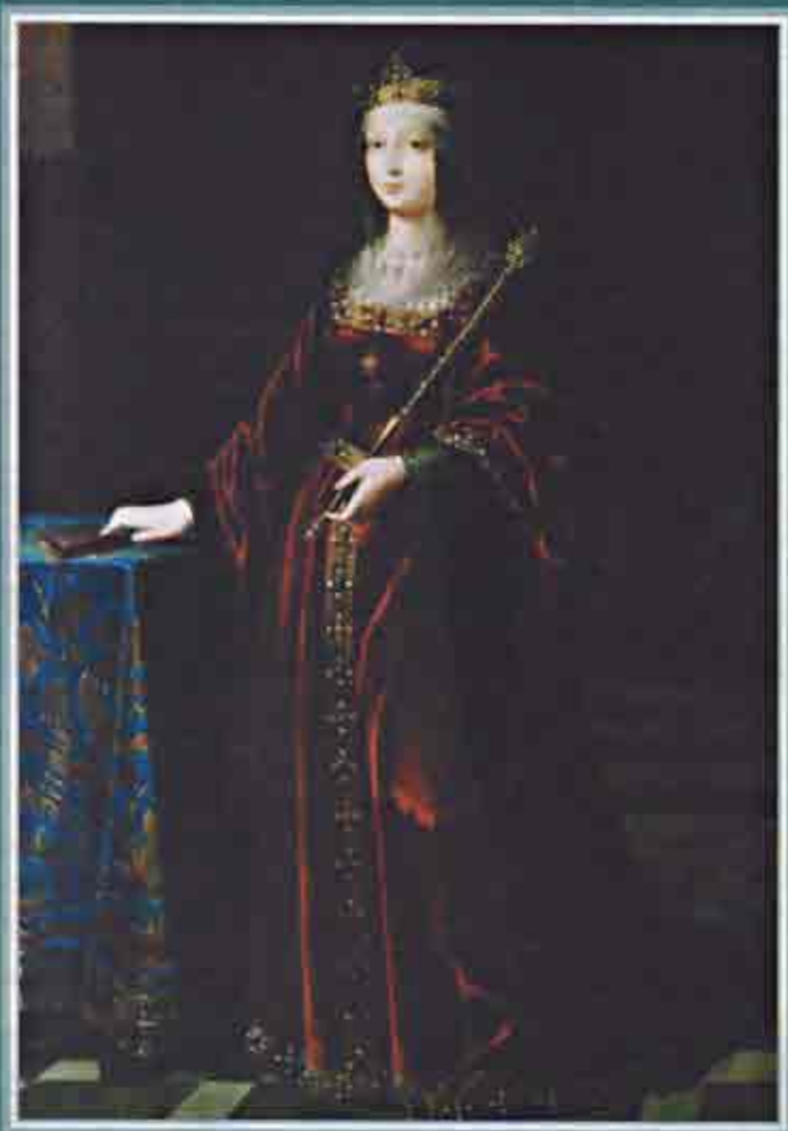
La Reina Isabel la Católica