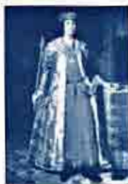
El Rey Fernando el Católico

D ESPUÉS de varios años de matrimonio, Isabel y Fernando tienen que afrontar una prueba. A Fernando le preocupaba que los acuerdos entre él y su mujer Isabel le hicieran parecer débil a los ojos de sus seguidores y súbditos. Incluso consideró la posibilidad de regresar al reino de su padre sin Isabel. La ternura de Isabel disipó los miedos de su marido. La historia nos ofrece un ejemplo perfecto de su sabiduría como esposa. Esa misma sabiduría la convierte en ejemplo para las esposas de hoy.