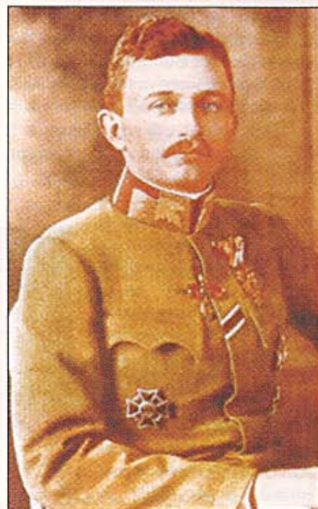
El Emperador Carlos I de Austria The Emperor Charles I of Austria

I am very pleased to have been invited to share three days of the journey with people who have come from all over the world, who have known all sorts of different spiritual experiences, who have all flocked around the same Pastor and have given testimony of His loving care for us... (Continues in the next issue of ISABEL™ )