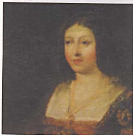
Isabel la Católica

(Continues in the next issue of ISABEL™ )