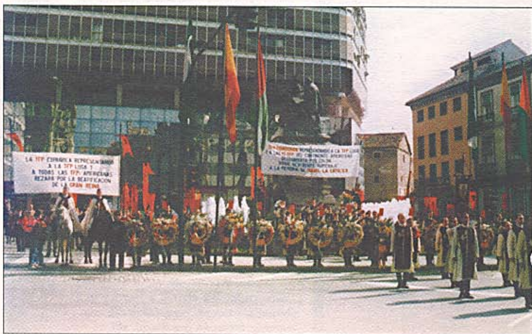
Celebración de los TPF en Granada