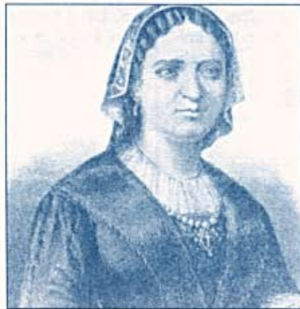
Juana la Beltraneja

el conde de Paredes, uno de los capitanes de Isabel. Incluso la ciudad de Villena se había levantado en armas contra él, pasándose al bando de la reina. Alonso de Cárdenas, el mismo que derrotara al duque de Medina Sidonia, había invadido Portugal por la frontera extremeña, llevando consigo como lugarteniente al Príncipe de la Juventud, Don Gonzalo de Córdoba. Y, al tiempo que Alfonso urgía a su hijo Don Juan para que le enviara refuerzos, de Portugal le llegaban llamadas angustiosas para que volviera a proteger su propio reino. Para colmo, Don Alfonso sufrió una amarga decepción de parte