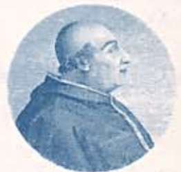
Alejandro VI Alexander VI

«Decretamos llamaros [a Isabel y Fernando] en adelante, por especial prerrogativa y privilegio CATÓLICOS... ocurresenos ante todo, como dignas de ser recordadas, las acciones de Vuestras Majestades, cuya justicia, religión, piedad, grandeza de alma, clemencia para la fe ortodoxa, celo insigne y devoción perenne a la Iglesia Romana, fulguró siempre en vosotros sobre todos los príncipes cristianos».