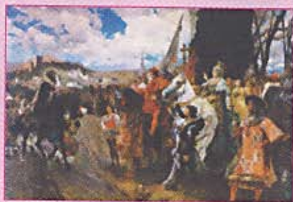
La Rendición de Granada/The Rendition of Granada

This was a crusade of all Christendom in defense of the Catholic Faith. Isabel was the «soul» of this Crusade.