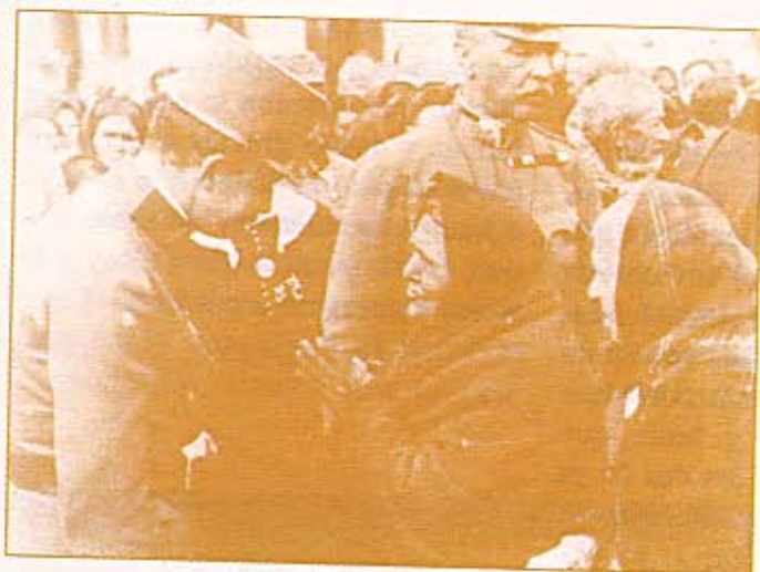
Emperador Carlos, descendiente de Isabel Emperor Karl, descendant of Isabel