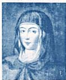
Reina Isabel Queen Isabel

«Isabel, desde su niñez, fue de tan excelente madre en la muy honesta y virginal limpieza criada».