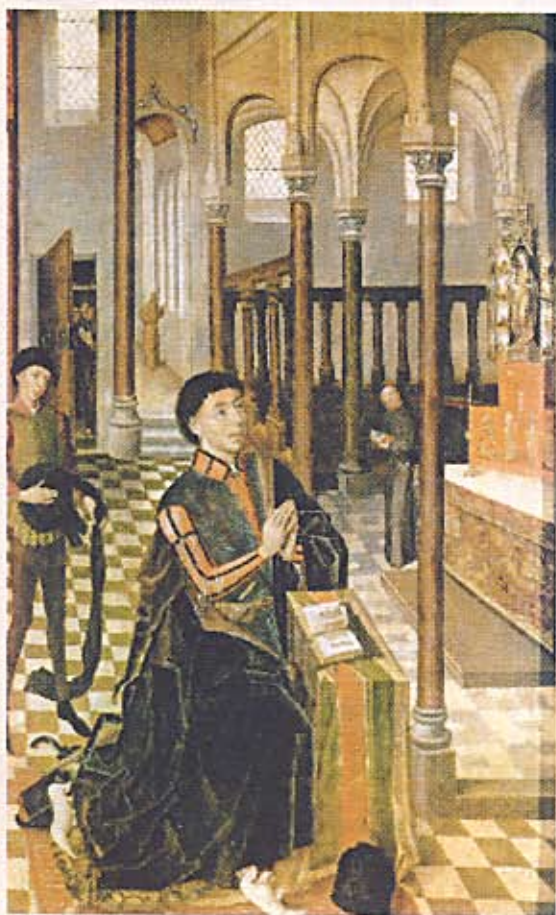
Retablo donado a la ermita Benedictina de Sopetrán, por la familia Mendoza. La opulenta familia Mendoza fue la principal patrocinadora del arte y arquitectura Renacentista en Castilla.

A reredos donated to the Benedictine hermitage of Sopetrán, by the Mendoza family. The immensely wealthy Mendoza family were the chief patrons of Renaissance art and architecture in Castile.