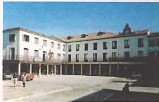
La Plaza Mayor de Tordesillas Main Square in Tordesillas