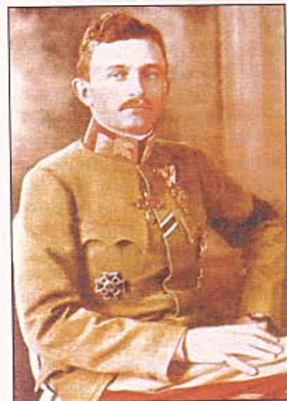
El Emperador Carlos I de Austria The Emperor Charles I of Austria

One of those cases, a major one, is that of Isabel the Catholic, Queen of Castile. Her repercussion in history is such that recently Humanitas , a review of anthropology and Christian culture published by the Pontifical Catholic University of Chile, made a survey among its con-