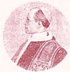
Papa Pio XII Pope Pious XII

«Those lands of the New World on which the moribund gaze of the great Isabel rested, in whose singular spirit we would want to evoke, not so much the strength of her political vision, but her maternal yearning for peace, dictated by a profoundly Christian concept of life that pleaded for those she called her sons of America to be treated with gentleness and devotion».