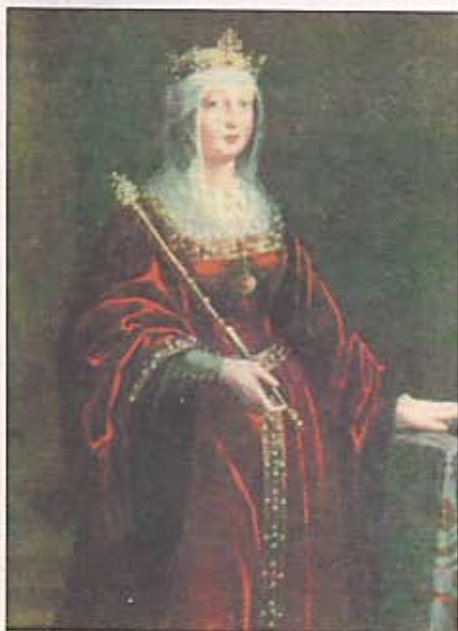
Isabel la Católica