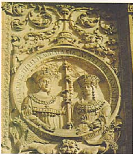
Universidad de Salamanca Salamanca University

A Hernán Cortés se le debe no sólo el hecho de la conquista material de los aztecas sino algo mucho más difícil como fue el inicio de la conquista espiritual. Con el objeto de que en estas tierras se iniciara la evangelización de modo sistemático, Hernán Cortés le pidió al Emperador Carlos V que enviase misioneros de santidad acrisolada.