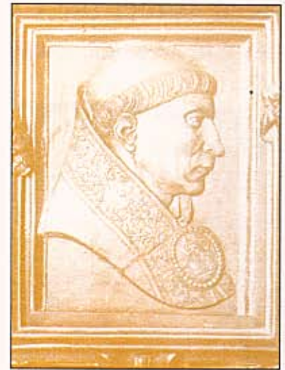
El Cardenal Cisneros Cardinal Cisneros

No olvidemos que Cortés —antes de embarcarse para el Nuevo Mundo y siendo un mozal-