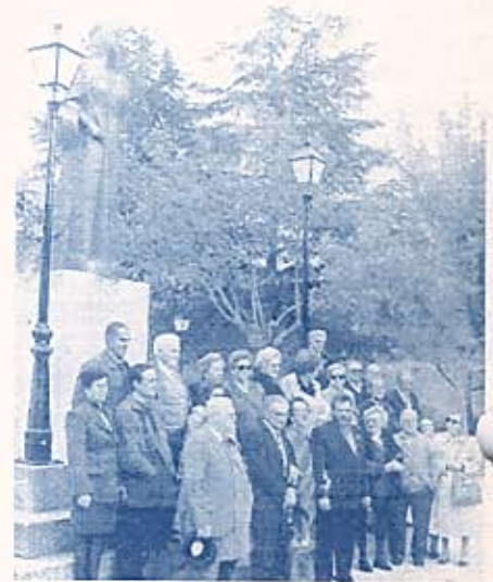
Caballeros y Damas posan junto al monumento a la Reina

Los actos concluyeron con el descubrimiento de una placa dedicada a la Reina Isabel en el Parque de la Hispanidad de Madrigal de las Altas Torres.