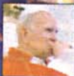
Su Santidad el Papa Juan Pablo II