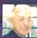
Rvdo. y Hon. G. Graham D. Leonard, Antiguo Obispo Anglicano de Londres