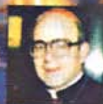
Excmo. Sr. Cardenal Alfonso López Trujillo, Presidente del Consejo Pontificio para la Familia