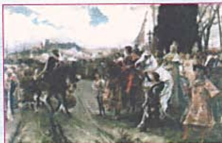
Rendición de Granada / Surrender of Granada

TO THE «VENERABLE DEAN AND COUNCIL: THE KING MY LORD IS ENTERING MIGHTILY INTO WAR WITH THE CITY OF GRANADA AND THAT IS WHY, AS YOU KNOW, THE PRAYERS, MASSES, AND OTHER DEVOTIONS ARE ABLE TO AID AND BENEFIT THIS EFFORT; THEREFORE, I BESEECH AND ENTRUST YOU TO FULFILL THIS ORDER AS IS CUSTOMARY IN THAT CHURCH AND IN ALL OF THE CITY AND BIS-