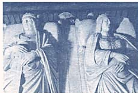
Sepulcros reales de Fernando (izqu.) e Isabel (dcha.) Royal Sepulchres of Ferdinand (left) and Isabel (right)

«Buscó fundamentalmente la extensión del Reino de Cristo».