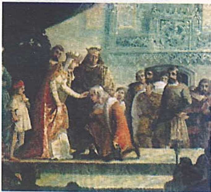
Los Reyes Católicos y Colón The Catholic Kings and Columbus

Today Roy has regained his strength entirely and is working