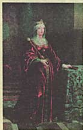
Poster of Isabel