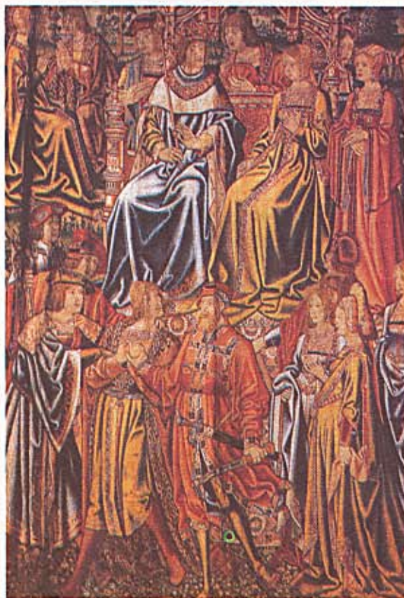
Representación idealizada del matrimonio de Isabel y Fernando en el Tapiz de las Bodas Reales (siglo XVI, Lérida Catedral Nueva)

The agreements that they signed were the following: