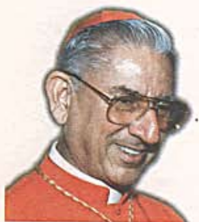
Emmo. Sr. Cardenal Darío Castrillón Hoyos

* Emmo. Darío Cardenal Castrillón Hoyos Prefecto para la Congregación del Clero