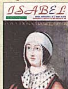
Ejemplar de la Revista