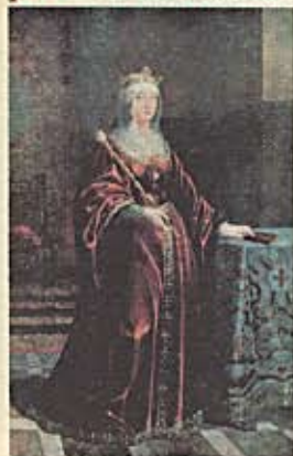
Poster de Isabel