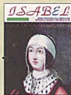
Copy of Magazine