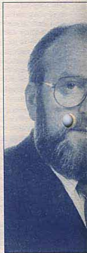
Alcalde de Madrigal de las Altas Torres Mayor of Madrigal de las Altas Torres

Si yo fuera el responsable crearía un comité con representantes de cada uno de estos pueblos y ciudades y empezaría ya la preparación de los actos.