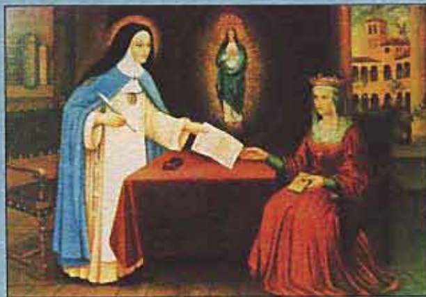
Santa Beatriz de Silva e Isabel la Católica, por una Concepcionista de Torrijos (Toledo)