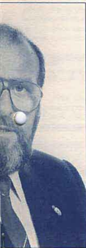
de las Altas Torres de las Altas Torres

If I had to do it I would form a committee with representatives of each one of these towns and cities and I would begin now the preparations.