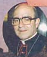
Emmo. Sr. Cardenal Alfonso López Trujillo Pte. Consejo Pontificio para la Familia-Vaticano