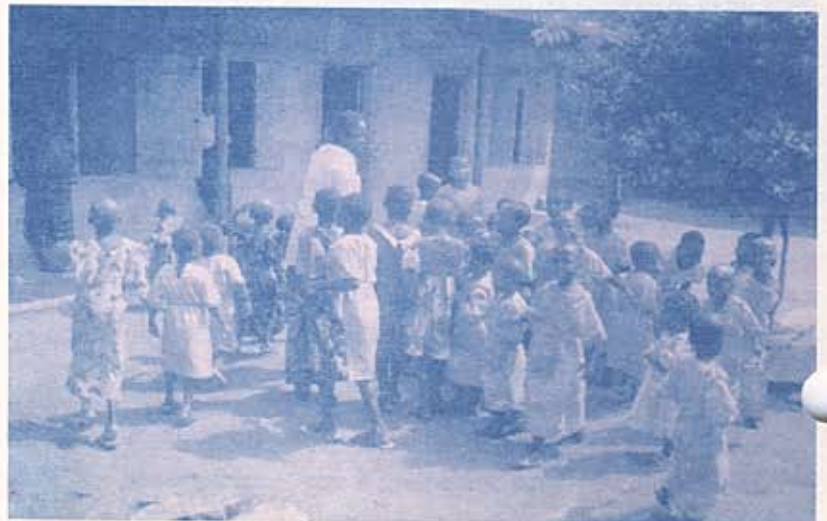
Algunas niñas de la Escuela infantil Reina Isabel en Nigeria