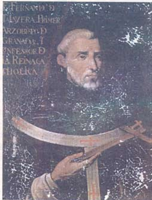
Fray Hernando de Talavera, confesor de la Reina y futuro Obispo de Granada.

prows to the west and on the 12th of October they encountered the prodigy of a new continent, a prodigy so great that in the beginning they did not realize what it really was.