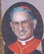
Emmo. Sr. Cardenal Darío Castrillón Hoyos Prefecto de la Con. del Clero- Vaticano