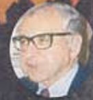
Dr. Bernard Nathanson Antiguo abortista, Judío Converso a la Iglesia Católica- EE.UU.