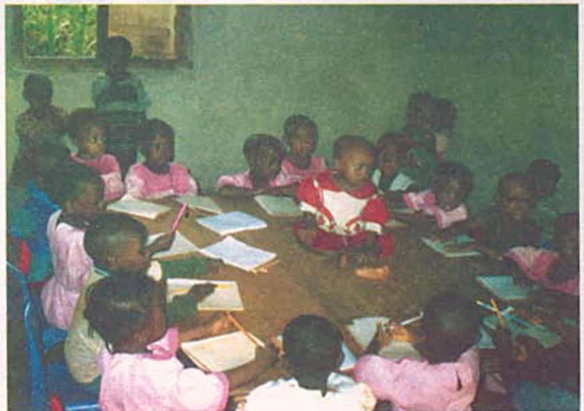
Some of the little girls of the Queen Isabel Nursery School in Nigeria.