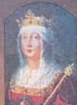
Sierva de Dios, Isabel la Católica