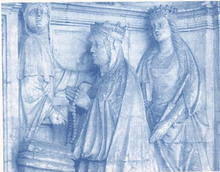
Parroquia de Santa Engracia (Zaragoza) La Reina Isabel, entre Santa Catalina y Santa Paula. St. Engracia Parish (Zaragoza) Queen Isabel, between St. Catheline and St. Paula.

14. While in the Middle Ages saints with royal blood abound, in the Modern Age they are absolutely lacking. Isabel the Catholic, in this aspect, could fill—at least partially—a vacuum which, to tell the truth, does not do us much honor.