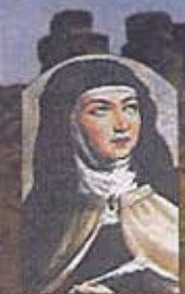
Sta. Teresa de Jesús