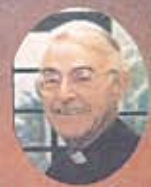
Rvdo. y Hon. Mons. Graham D. Leonard Antiguo obispo anglicano de Londres, hoy sacerdote católico.