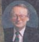
Hon. Sr. D. John Gummer M. P. Presidente del "Camino a Roma," Miembro del Parlamento Inglés y Converso de la Iglesia Anglicana