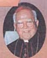
Emmo. Sr. Cardenal Luis Aponte Martínez Arzobispo Emérito de San Juan, P.R.