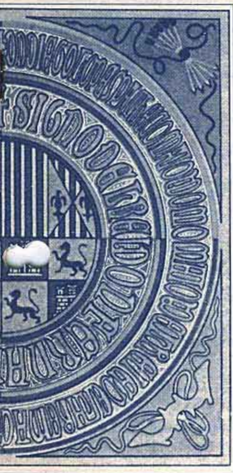
Reyes Católicos King's Seal