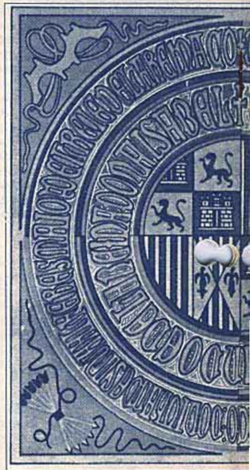
Sello rodado de los Catholic K