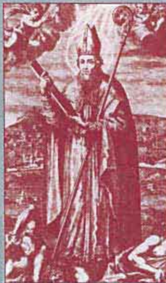
Santo Toribio Alfonso de Mogrovejo.

Toribio murió el día de Jueves Santo, el 23 de marzo de 1606. El Papa Benedicto XIII canonizó a Toribio el 23 de marzo de 1726 y el Papa Juan Pablo II lo proclamó Patrono de los Obispos Iberoamericanos el 10 de mayo de 1983.