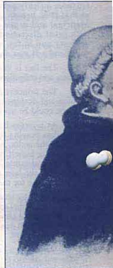
Fray Tomás de Torquemada, Gran Inquisidor de España

Después que la reina dirigió la última y victoriosa batalla en Granada que finalizó la guerra de 770 años con los moros, el jubiloso ejército decidió llamar el campamento «Isabel» en su honor. Ella dijo: «¡No! Llamémoslo 'Santa Fe'. ¿No corresponde que la Iglesia que ella tanto amó durante su vida, le otorgue su más alto honor - ser elevada a los altares de la santidad?