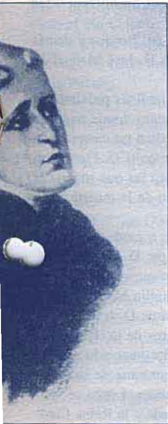
120-1498, Dominico y primer na desde 1483 a 1498.

After the queen led the final and victorious battle at Granada ending the 770 year war with the Moors, the jubilant army decided to name the camp «Isabel» in her honor. She said, «No! Let us call it 'Holy Faith.'» It is not fitting that the Church which she loved so greatly and constantly during her life extend to her the highest honor — that of being raised to the altars of Sanctity?